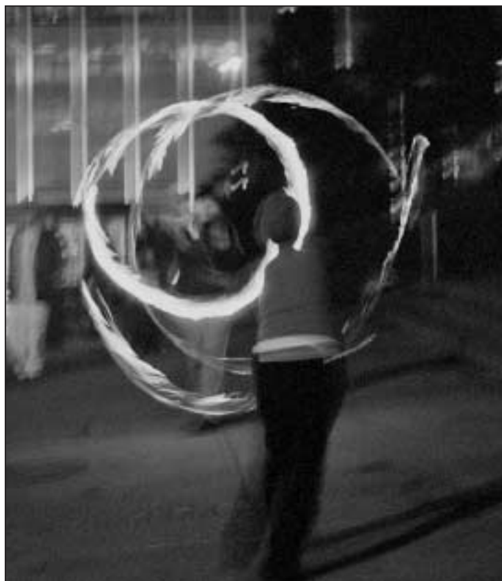
Ildsjonglører fra sjonglørgruppa "Nei, vi skal ikke jobbe på Sirkus"

Mellom appellene var det kulturelle innslag, blant annet sang