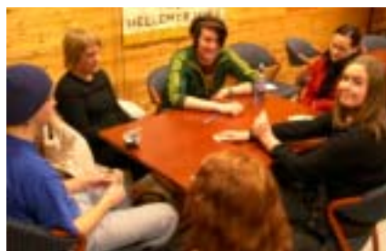
Det blir også tid til kortspill og kaffeslaberas