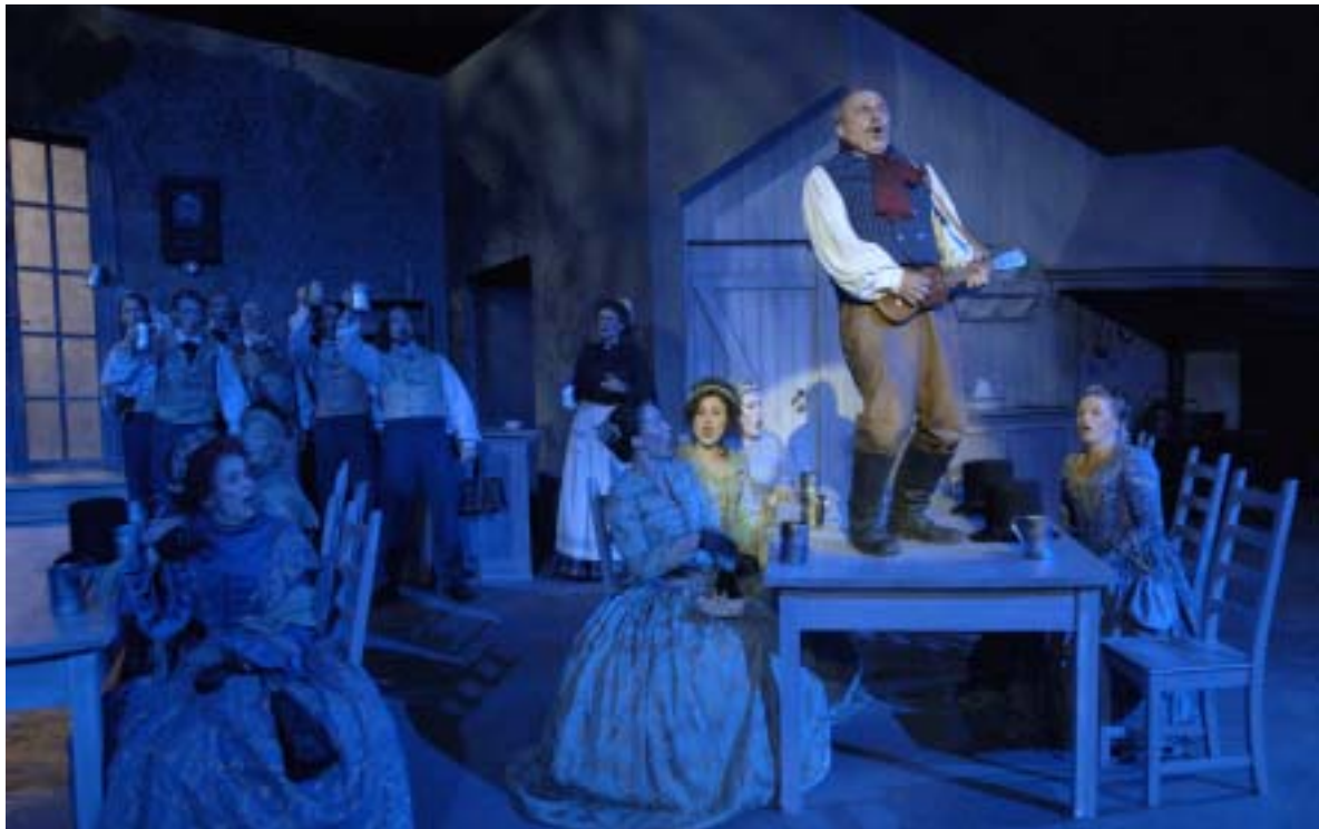
Nattbilde av Agder Teater – Fjæreheia