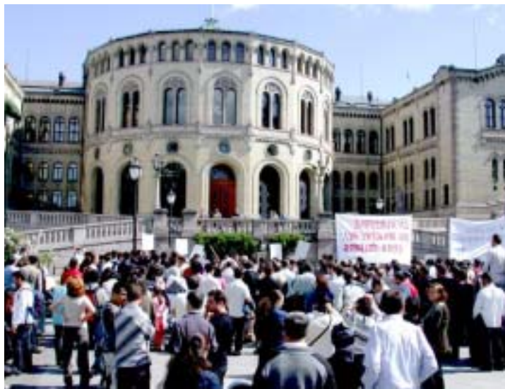
Fra en av MUF-demonstrasjonene tidligere i år.