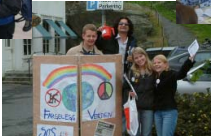
... og aksjon på byen for glade grupper