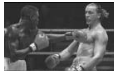
Ole Lukkoye fortsetter kampen utenfor ringen...

Så mange muslimer vil vi ha på våre hjemmesider.