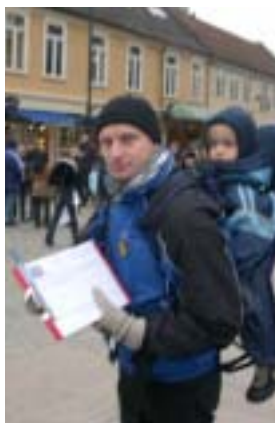
Aksjon på byen for store og små...