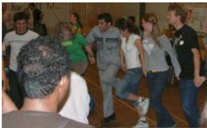
For noen er LLK kurdisk dans døgn rundt.