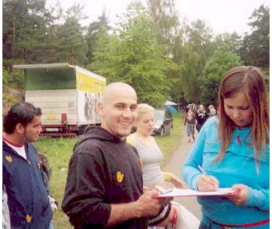
Karsaz Barzingey i aksjon på Skjærgårdsgospel

Signerte artikler står for artikkelforfatterens eget syn, og samsvarer ikke nødvendigvis med SOS Rasisme sitt syn.