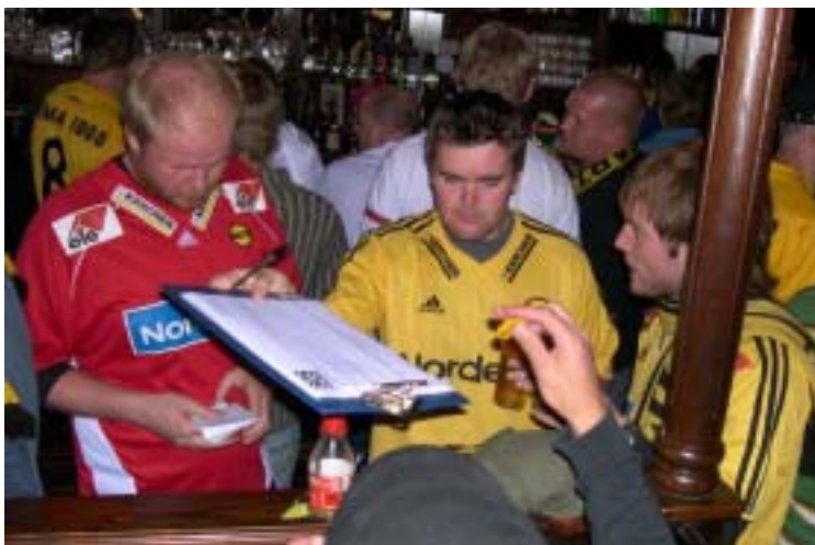
«Send den rundt» – alle kanarifans vil skrive seg på.