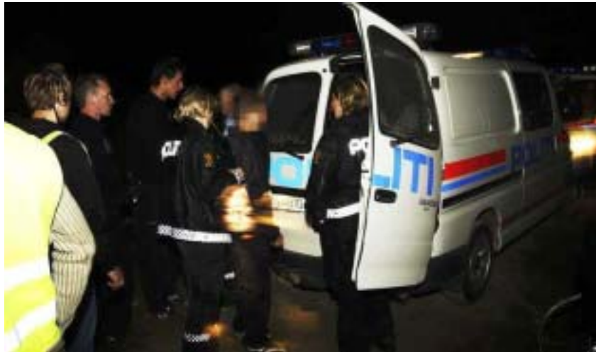
Natten ble tryggere etter at politiet fjernet nazistene fra Storåsfestivalen.

Dette viser at SOS Rasisme bør jobbe mer opp i mot §4.2.4 i prinsippprogrammet, ettersom at dette mest sannsynlig er et utbredt problem i Norge.