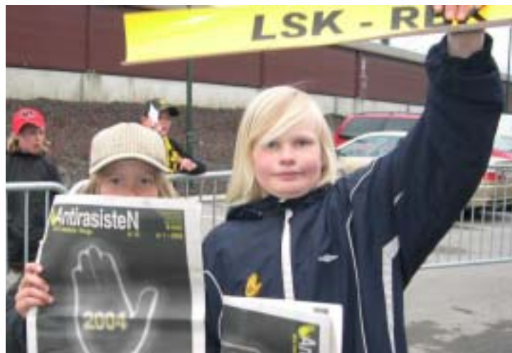
LSK for de små – stopp rasismen nå!