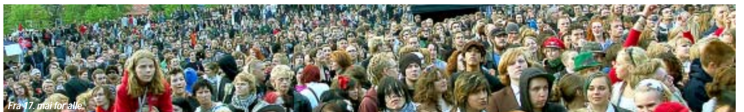
Fra 17. mai for alle.

31. Afrikanere som ønsker å trene ved Galaxy treningssenter på Veitvet i Oslo blir avvist og får beskjed om at det er fullt. Hvite nordmenn får derimot medlemskap på dagen.