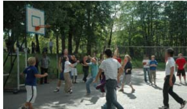
Spillerne fra Asker Aliens var gode å ha med på laget.