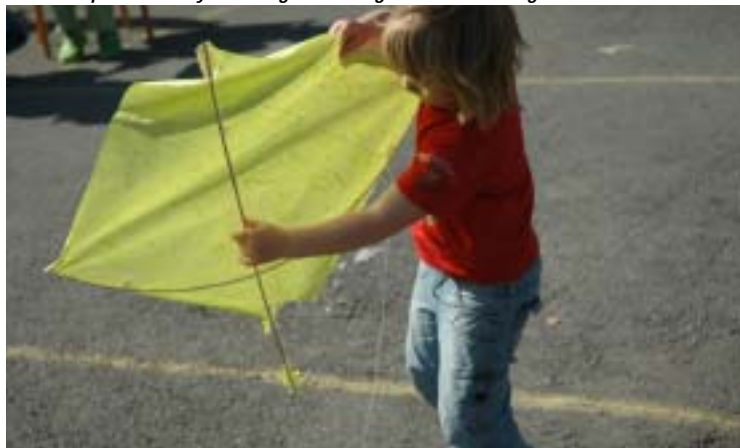
Afghanske drager var en suksess for store og små.