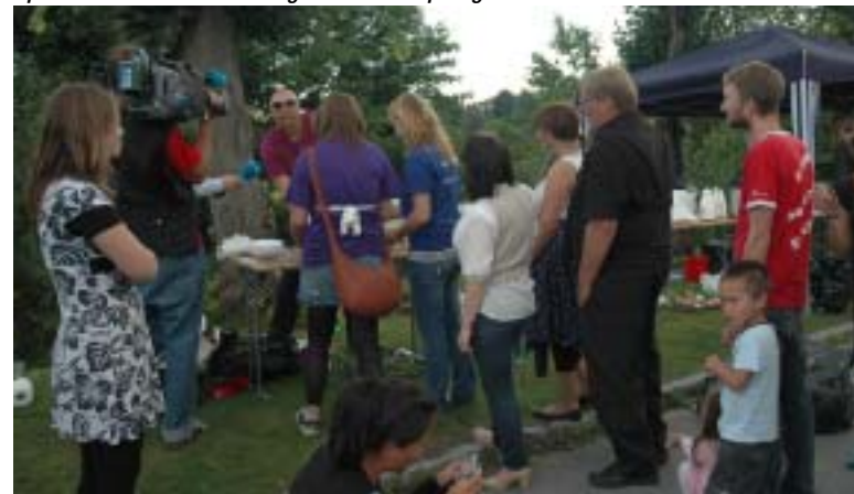
Velforeningens vaffelpresser var en populær mann.

Sammen med ERFA og asylmottaket arrangerte SOS Rasisme åpen dag ved Hvalstad asylmottak lørdag 16.august.