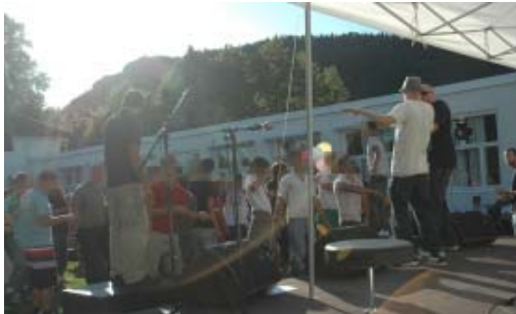
Jester skapte svært høy stemning i det sola gikk ned bak Skaugumåsen.