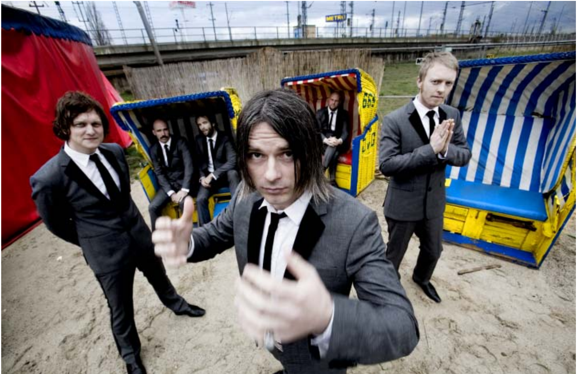
Norske Kaizers Orchestra spilte for et utsolgt Øya.