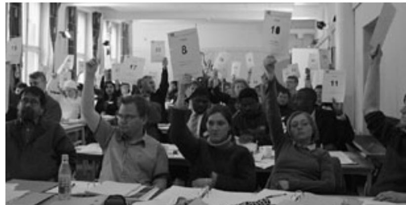
Nord-Trøndelagsbenken viser stemmetegn.

26. – 28. april 2002 var antirasister fra hele Norge samlet til SOS Rasismes 8. ordinære Landsmøte på Hersleb skole i Oslo. Møtestedet var nok ikke de fleste førstevalg, men godt var det da at det faktiske innholdet på Landsmøtet holdt en betydelig høyere standard