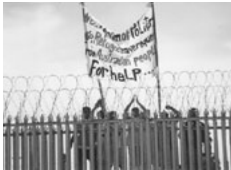
Et rop om hjelp: Flyktninger bak gjerdet i Woomera, påsken 2002.

– Dette gjør det for eksempel vanskelig å ha kontakt med advokater under asylbehandlingen.