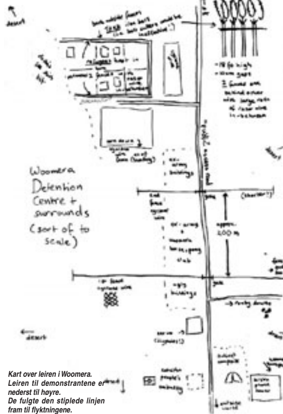
Kart over leiren i Woomera. Leiren til demonstrantene er nederst til høyre. De fulgte den stiplede linjen fram til flyktningene.

Kampen for menneskerettigheter fortsetter for RAC og andre som er bekymret for rettsvernet til flyktninger.