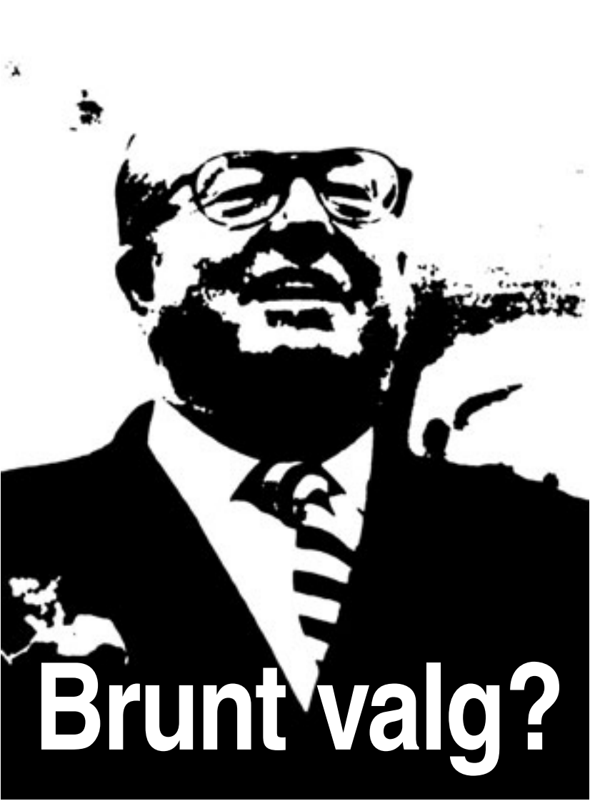
Jean-Marie Le Pen, leder for Front National, som har gått fra å være høyreekstrem rasist til å bli en av de mest populære politikerne i Frankrike.

Representanter for valgmyndighetene sier at ”et demokratisk valg i Frankrike er ikke blitt et stykke teater, ennå”.