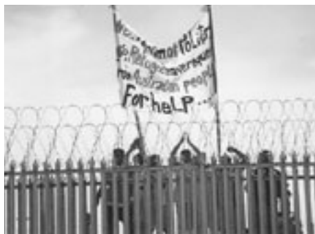
Et rop om hjelp: Flyktninger bak gjerdet i Woomera, påsken 2002.

– Dette gjør det for eksempel vanskelig å ha kontakt med advokater under asylbehandlingen.