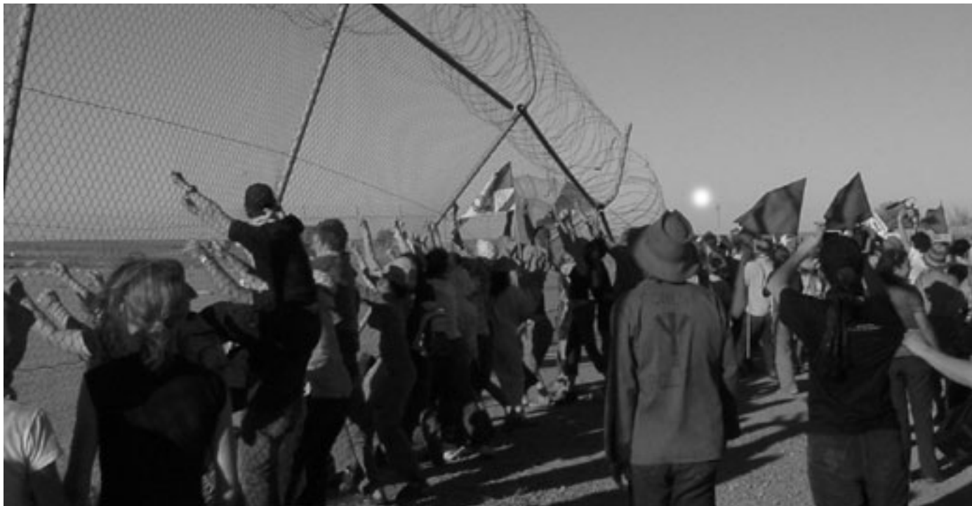
Langfredag, 29. april 2002, ble gjerdene rundt forvaringsleiren Woomera angrepet. Deltakere fra universiteter, fagforeninger og antirasistiske grupper over hele Australia deltok i demonstrasjonene mot Woomera. I tillegg fant det sted mange demonstrasjoner andre steder i Australia.

– Dette gjør det for eksempel vanskelig å ha kontakt med advokater under asylbehandlingen.