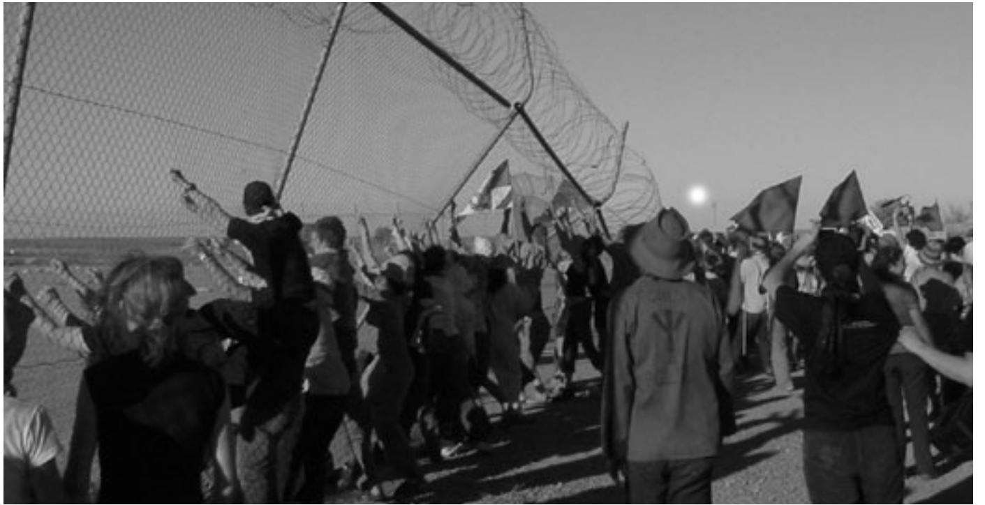
Langfredag, 29. april 2002, ble gjerdene rundt forvaringsleiren Woomera angrepet. Deltakere fra universiteter, fagforeninger og antirasistiske grupper over hele Australia deltok i demonstrasjonene mot Woomera. I tillegg fant det sted mange demonstrasjoner andre steder i Australia.

– Dette gjør det for eksempel vanskelig å ha kontakt med advokater under asylbehandlingen.