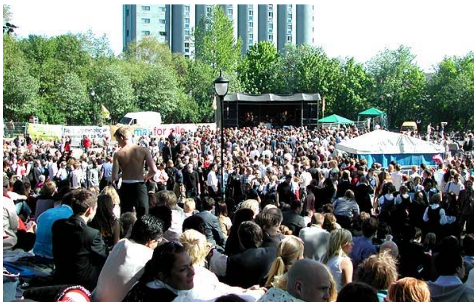
Fortsatt masse publikum

Økonomi er en av de viktigste sidene ved å arrangere en konsert. En god oversikt over utgifter og inntekter er veldig viktig slik at en ikke mister kontroll over utgiftene. Her følger en del tips om noen av de viktigste sidene ved økonomistyring av en konsert.