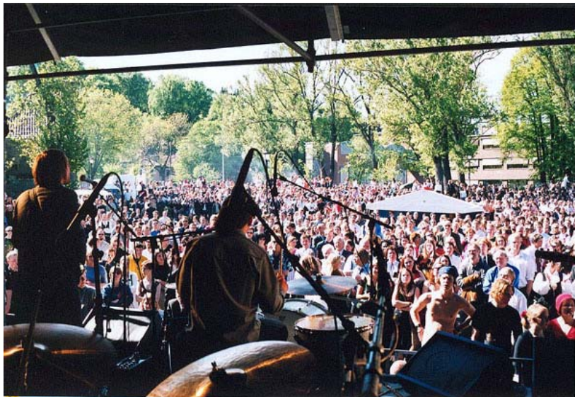
Publikum med The Margarets i forgrunnen

For å gjennomføre et arrangement trenger en penger og det finnes et mange støttordninger som dere som konsertarrangør kan benytte seg av. Det er viktig å søke, da det kan være en del penger å hente her.