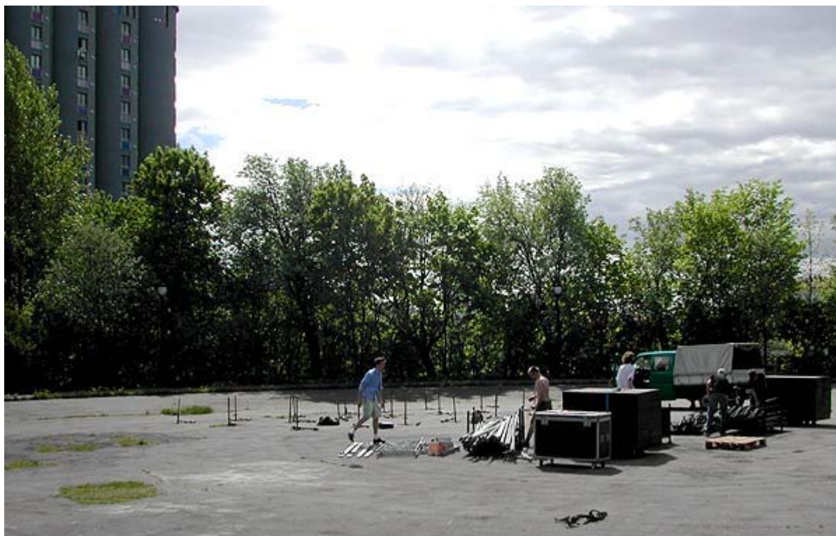
Scenen begynner å ta form

Hver gruppeleder har en selvsagt personer til å hjelpe seg. Det er nyttig at disse personene får en del viktige oppgaver og blir lært godt opp, slik at etterveksten til lokallaget er god.