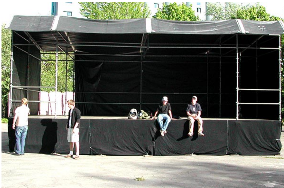
Scenen er ferdig!

SOS Rasisme er Norges eneste landsdekkende, demokratiske medlemsorganisasjon som bare jobber mot rasisme. Vi har over 40 000 medlemmer og 90 lokallag over hele landet, og er Europas største organisasjon på vårt felt.